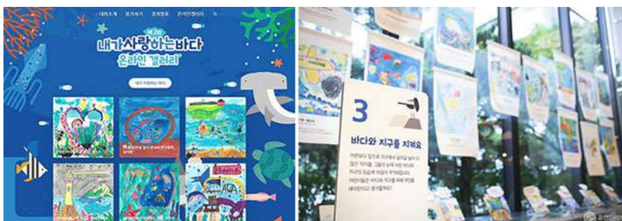
Exposición de arte (en línea y fuera de línea)