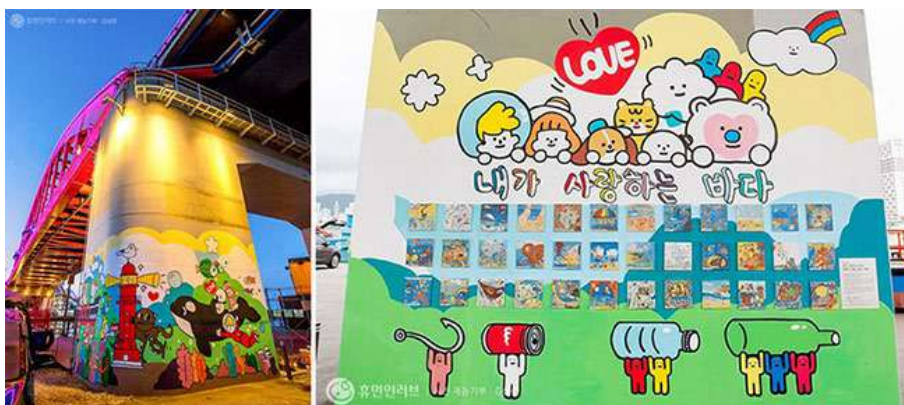
Instalación de dibujos infantiles y murales en la playa (Puente Seorak en Sokcho, República de Corea)